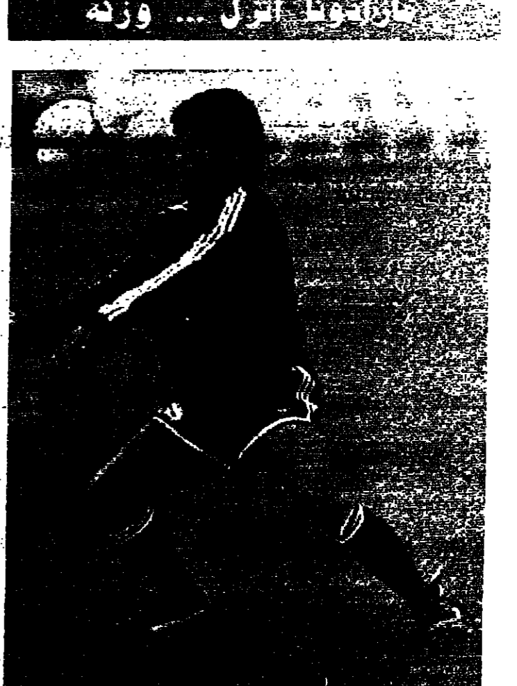
بعد فوز فريهه ببطولات ايطاليا اتجه النجم الارجنتيني دييفو مارادونا الى المتمردين ويكسف مكافئ انزال وزنه وقد نجح بذلك وانخفض وزنه ثمانية كيلو غرامات ويبدو في الصورة يمتحن قبيل مباراة الارجنتيني والنمسا.

وقال الرئيس الاسد ان مخطوفه انما هي نتيجة لسياسة اسرائيل التي تستهدف ابناء العرب في ايرالين وبيروت حيث اشتغل اليوم في استمرار حيل الرهائن.